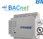
INBACMID (1) (CL99222/ CL99210)