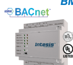
INBACMID (1) (CL99222/ CL99210)