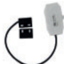
Türkontakt (EC 06 191)