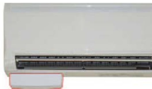
En bas à gauche du climatiseur