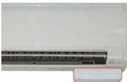
En bas à droite du climatiseur