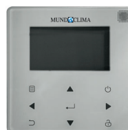
KJRH-120H/BMK0-E cód. CL09204 (incluido)

Todos los equipos vienen desde fábrica con un control remoto cableado de pared para controlar la unidad desde el interior de la vivienda. Este mando incorpora un módulo wifi que permite controlar el equipo remotamente y protocolo Modbus para integrarla a un sistema de gestión.