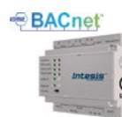
INBACMID (CL 99 222 / CL 99 210)