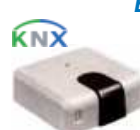
IS-IR-KNX-1i (CL 99 096)