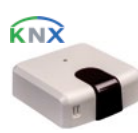
IS-IR-KNX-1i (CL 99 096)