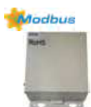
FCUKZ-03 (CL 94 974)