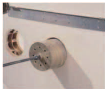
Deux trous Ø162 mm