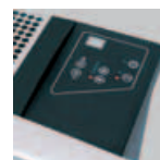
Panneau de contrôle intégré