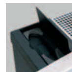
Coffre-fort pour télécommande