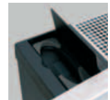
Aufbewahrungsfach für die Fernbedienung