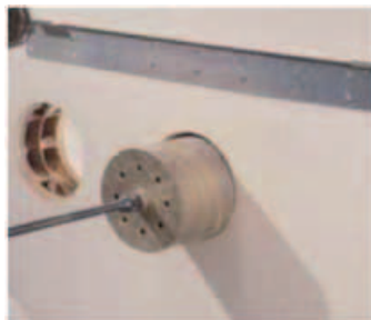
Zwei Löcher Ø162 mm