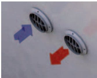
Außengitter aus EPDM (patentiert)