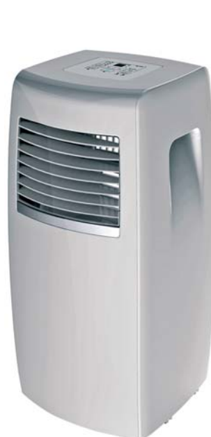
MUPO-07-C4 (Sólo frío)

reducción de la humedad restableciendo una temperatura óptima en ambientes húmedos