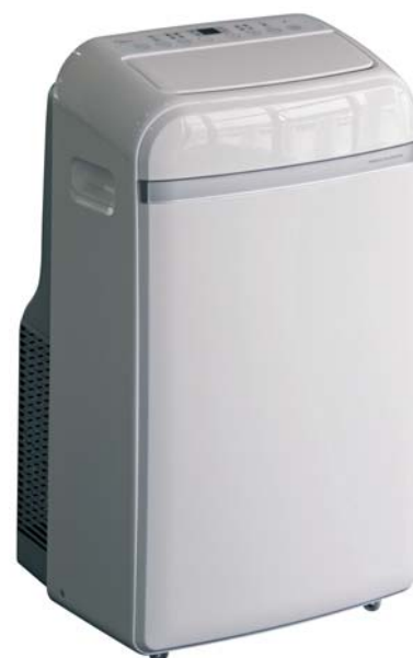
MUPO-09-H4 MUPO-12-H4 (Bomba calor)