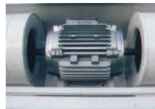
Motor de doble eje.