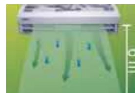
Altura máxima de instalación 6 m.