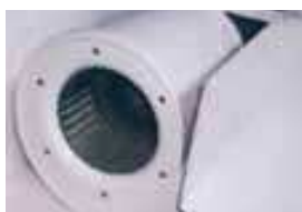
Ventilador centrífugo de alta capacidad.