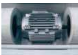
Motor de doble eje.