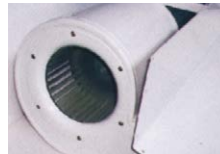
Ventilador centrífugo de alta capacidad.