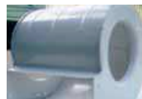
Carcasa del ventilador metálica.