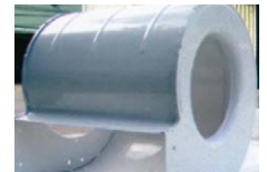
Carcasa del ventilador metálica.