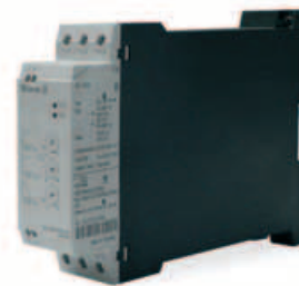
Soft starters electrónicos para reducir la corriente de arranque de los compresores.