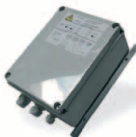
Kit control modulante de la ventilación.