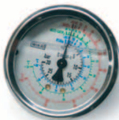
Manómetros HP - LP lado refrigerante.