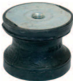
Soportes antivibraciones de apoyo.