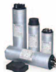
Kit condensadores de compensación de fase.