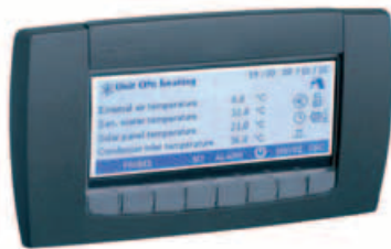
Kit terminal remoto ambiente (TOP).