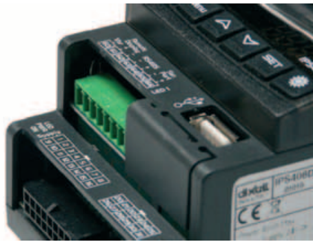
Interfaz RS 485 Modbus.