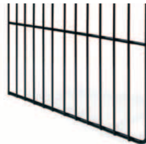
Rejillas de protección baterías.