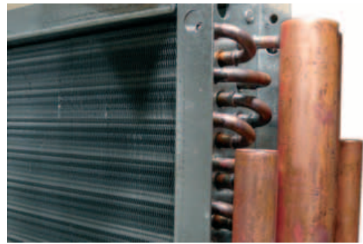
Baterías de aletas prepintadas o de cobre.