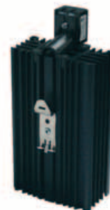
Kit ventilación/calentamiento cuadro eléctrico.