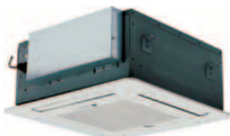
Cassette 4 vías