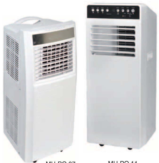
MU-PO 07 (Nur kühlen)

ENTFEUCHTEN Reduziert die Feuchtigkeit und garantiert eine ideale Temperatur in feuchten Räumen.