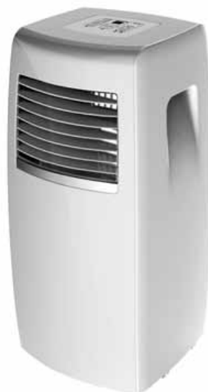
MUPO-07-C4 (Seulement froid)

Réduction de l'humidité en rétablissant une température