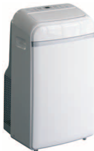
MUPO-12-H4 (Pompe à chaleur)