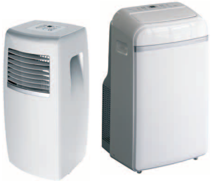
MUPO-07-C4 (Nur Kühlen )

Reduziert die Feuchtigkeit und garantiert eine ideale.