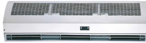
Mod. Sólo Aire