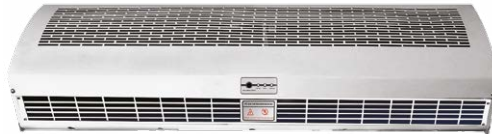
Mod. con Calefacción